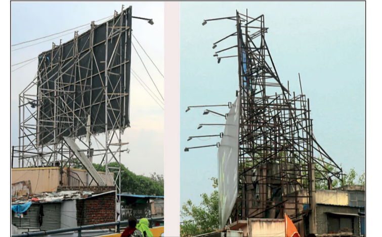
पडल्यानंतर शहरातील सर्व होर्डिंगची केली होती. मात्र, त्यावर पुढे काहीच तपासणी केली जाईल, अशी घोषणा झाले नाही.

पण महापालिकेने आतापर्यंत एकदाही होर्डिंग, संबंधित इमारत खरेच मजबूत आहे का? याची उलटतपासणी केलेली नाही. वाघोली येथे होर्डिंग