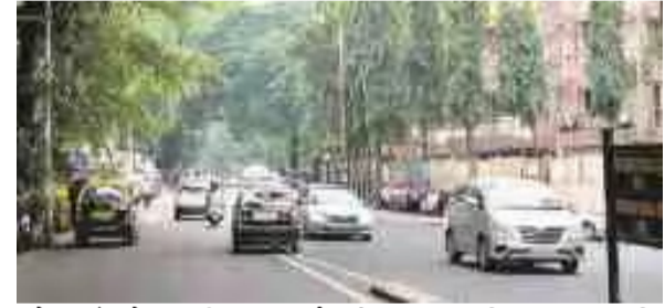
उमेदवारांमध्ये ही लढाई

या जाहीरनाम्यात मलबार परिसरातील विविध प्रश्नांबंधी मागण्या करण्यात आल्या आहेत. यामध्ये पर्यावरण, प्रदूषण हे विषय मुख्यत्वे घेण्यात आले असून त्यानंतर वाहनतळाचा मुद्दा मांडण्यात आला आहे. यामिनी जाधव यांची अनुपस्थिती दक्षिण मुंबईत महायुतीतर्फे शिंदे यांच्या शिवसेनेच्या यामिनी जाधव यांना उमेदवारी देण्यात आली आहे. तर महाविकास आघाडीकडून ठाकरे गटाचे अरविंद सावंत उमे आहेत. त्यामुळे शिवसेनेच्याच दोन