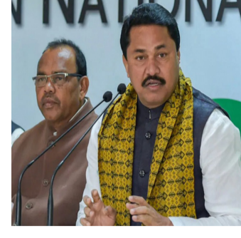
कोणाला तरी बळीचा बकरा करून

आहेत असा आरोप त्यांनी केला. तसेच मुंबई महानगर पालिका, राज्य सरकार व पोलीस प्रशासनाचे आशीर्वाद असल्याशिवाय असे अनधिकृत होर्डिंग लावले जाऊ शकत नाहीत. घाटकोपरच्या होर्डिंगला कोणी परवानगी दिली होती, त्यामागे कोणत्या राजकीय नेत्याची शिफारस होती का, या सर्वांचे सखोल चौकशी करून खऱ्या दोषींवर कारवाई झाली पाहिजे. कारवाईच्या नावाखाली